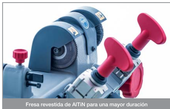
Fresa revestida de AITIN para una mayor duración

Las mordazas de cuatro lados cortan una amplia gama de llaves planas y el revestimiento de níquel asegura una larga duración. La distancia entre ejes de 128 mm entre las mordazas permite cortar también llaves con cuello largo y llaves de automóviles con mecanismo flip. Las mordazas se pueden girar rápidamente sin desmontarlas.