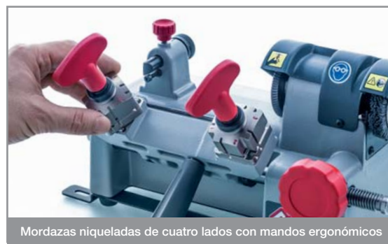
Mordazas niqueladas de cuatro lados con mandos ergonómicos

El cepillo para eliminar las rebabas de la llave tras el corte es de tynex y está protegido con una cubierta.